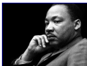
La utopía de Martin Luther King