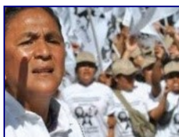
Milagro Sala, Leopoldo López y el doble discurso de Macri