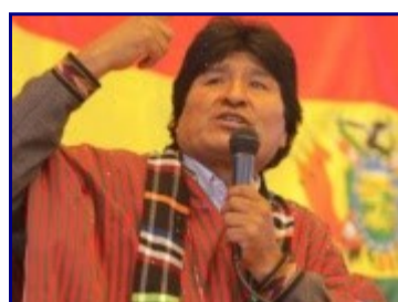
Evo Morales, un líder excepcional